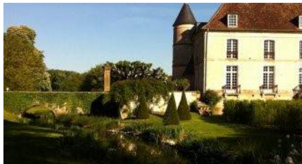
Le Parc et Château de Pesselières

Ouvert du mercredi au samedi de 14h à 18h, dimanche et jours fériés de 15h à 18h 3 € • 02 48 73 87 57