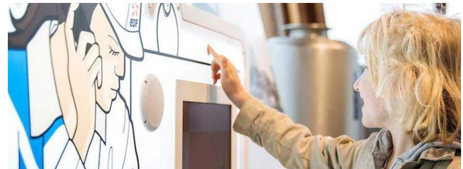
Centre d'Information du Public à Belleville-sur-Loire

Du lundi au vendredi (sauf jours fériés) de 8h30 à 12h30 et de 13h30 à 17h30 Gratuit • 02 48 54 50 92