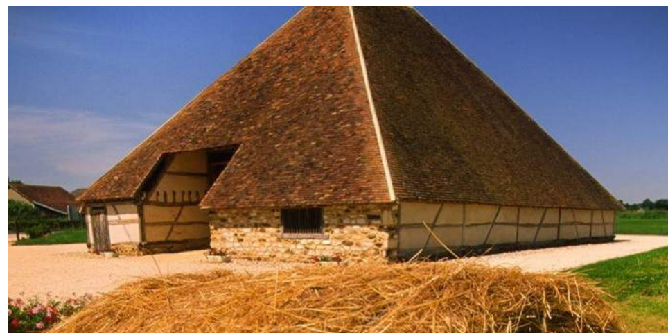
La Grange Pyramidale de Vailly-sur-Sauldre

Ouvert du mercredi au samedi de 14h à 18h, dimanche et jours fériés de 15h à 18h 3 € • 02 48 73 87 57