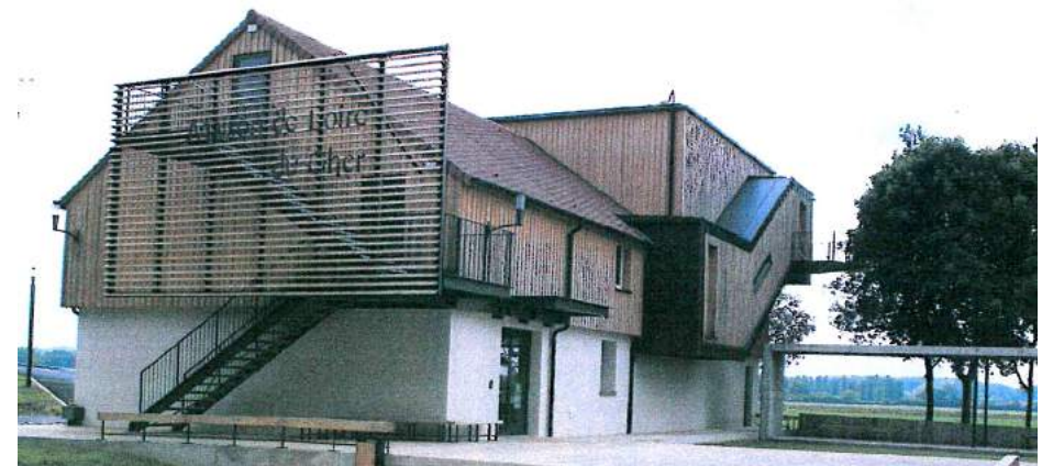
Maison de Loire du Cher à Belleville-sur-Loire

Du lundi au vendredi (sauf jours fériés) de 8h30 à 12h30 et de 13h30 à 17h30 Gratuit • 02 48 54 50 92