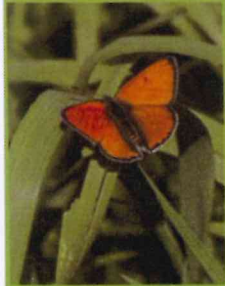
Cuivré des Marais (prairies humides)