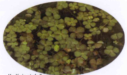
Marsilée à quatre feuilles (zones humides)