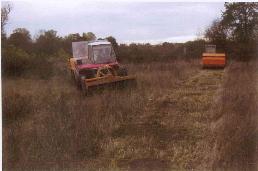
Chantier de restauration de milieu aux abords de la Loire

L'évaluation des incidences Natura 2000 doit toujours être conclusive. Elle doit comporter une phrase ou un paragraphe précisant l'incidence ou non du projet sur les objectifs de conservation du site concerné.