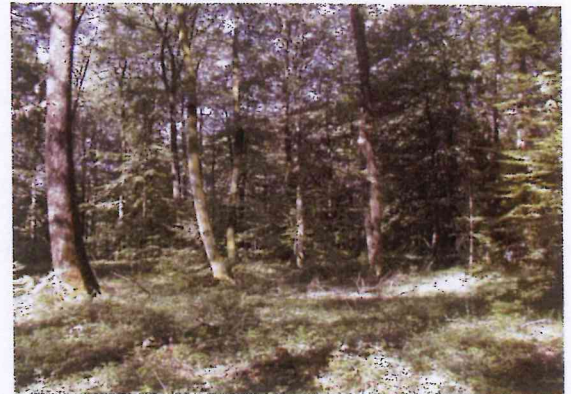
Forêt hêtraie à houx

OUI , les incidences de mon projet sont significatives >> je poursuis l'évaluation et passe à l'étape n°3