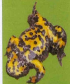
Sonneur à ventre jaune