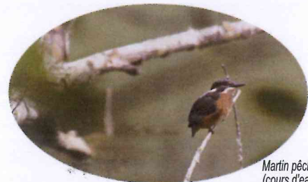
Martin pêcheur (cours d'eau)