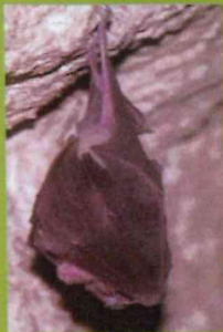
Petit Rhinolophe (bâtiment et site cavernicole)