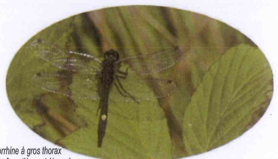
Leucorrhine à gros thorax (mares forestières et étangs)