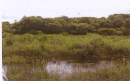
Bas marais calcaire